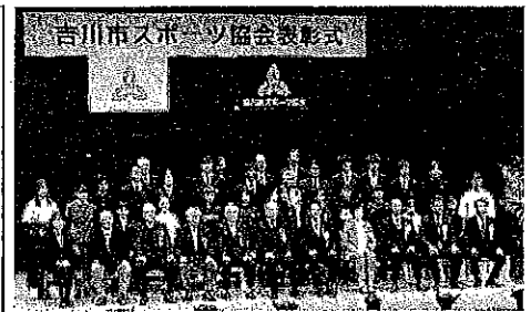
表彰式の様子（一部生徒のみ）