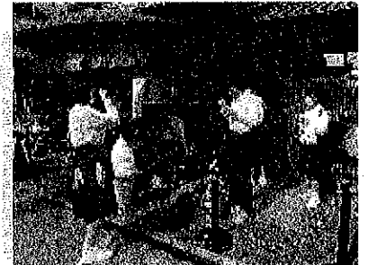
3年生校外学習川越方面 天気がよく楽しく活動できました