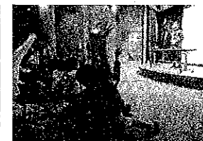
児童館サイエンスショー